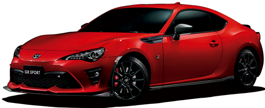
86 GR SPORT (AT車)

TOYOTAは、86に「GR SPORT」を新設定し、全国のトヨタ店、トヨペット店、トヨタカローラ店、ネッツ店を通じて、7月2日に発売しました。