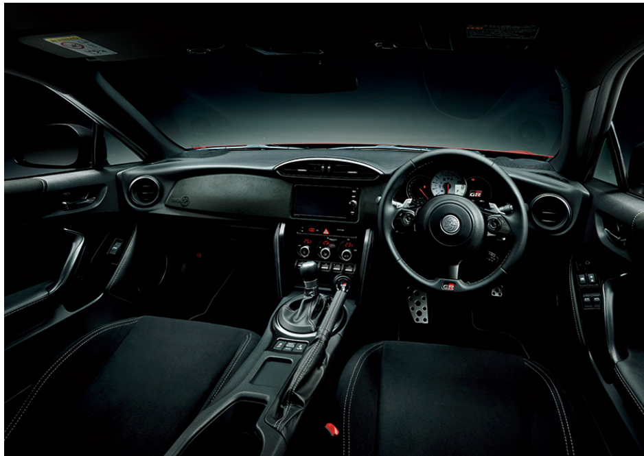
86 GR SPORT (AT車) <オプション装着車>