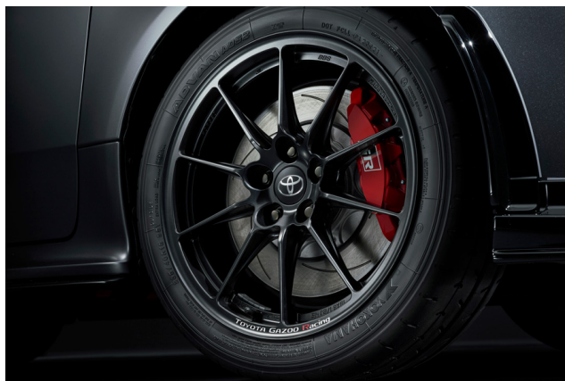
BBS製 GRMN専用 18インチホイール