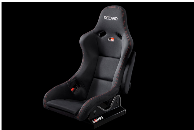
レカロ製 フルバケットシート (サイドエアバック付き)