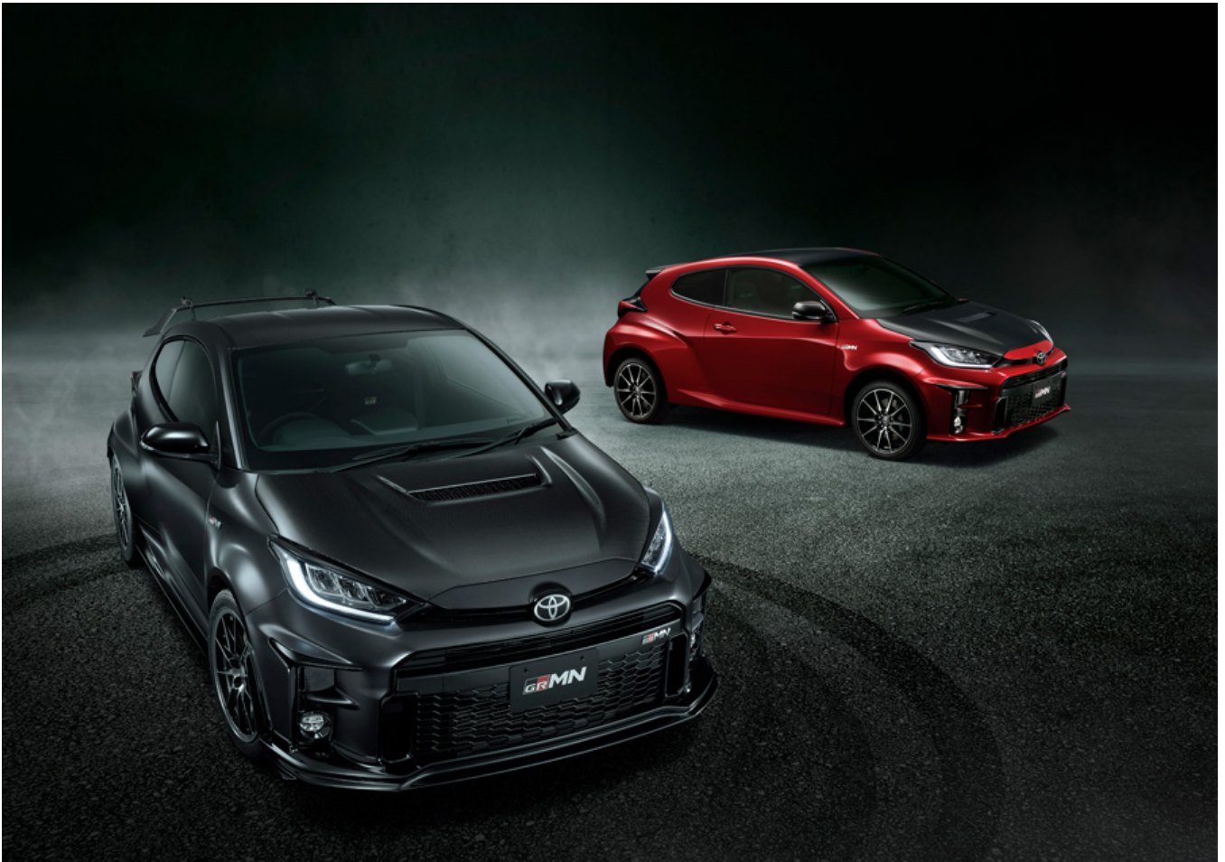
GRMNヤリス“Circuit package”／GRMNヤリス“Rally package”

GRヤリスは、一昨年9月の発売以降、モリゾウこと社長の豊田がステアリングを握りROOKIE Racingから参戦したスーパー耐久シリーズ ※4 や、シーズン優勝を果たした全日本ラリー選手権 ※5 など、様々なモータースポーツに参戦しています。