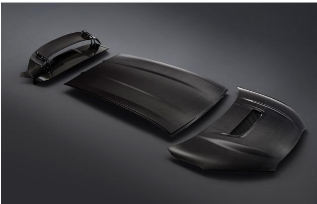
カーボン（綾織CFRP）パーツ