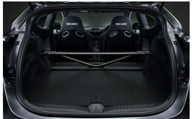
ボディ補強ブレース