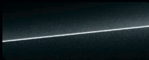
Mythossschwarz Metallic sideblades in Carbon matt