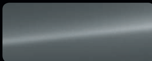
Daytonagrau Matteffekt sideblades in Carbon matt