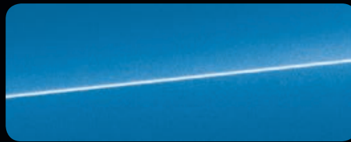
Arablau Kristalleffekt sideblades in Carbon matt